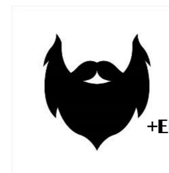
Pista nº 4

¡Comienza la gran aventura de los retos "EN BUSCA DEL LIBRO PERDIDO"!