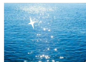
Pista nº 3